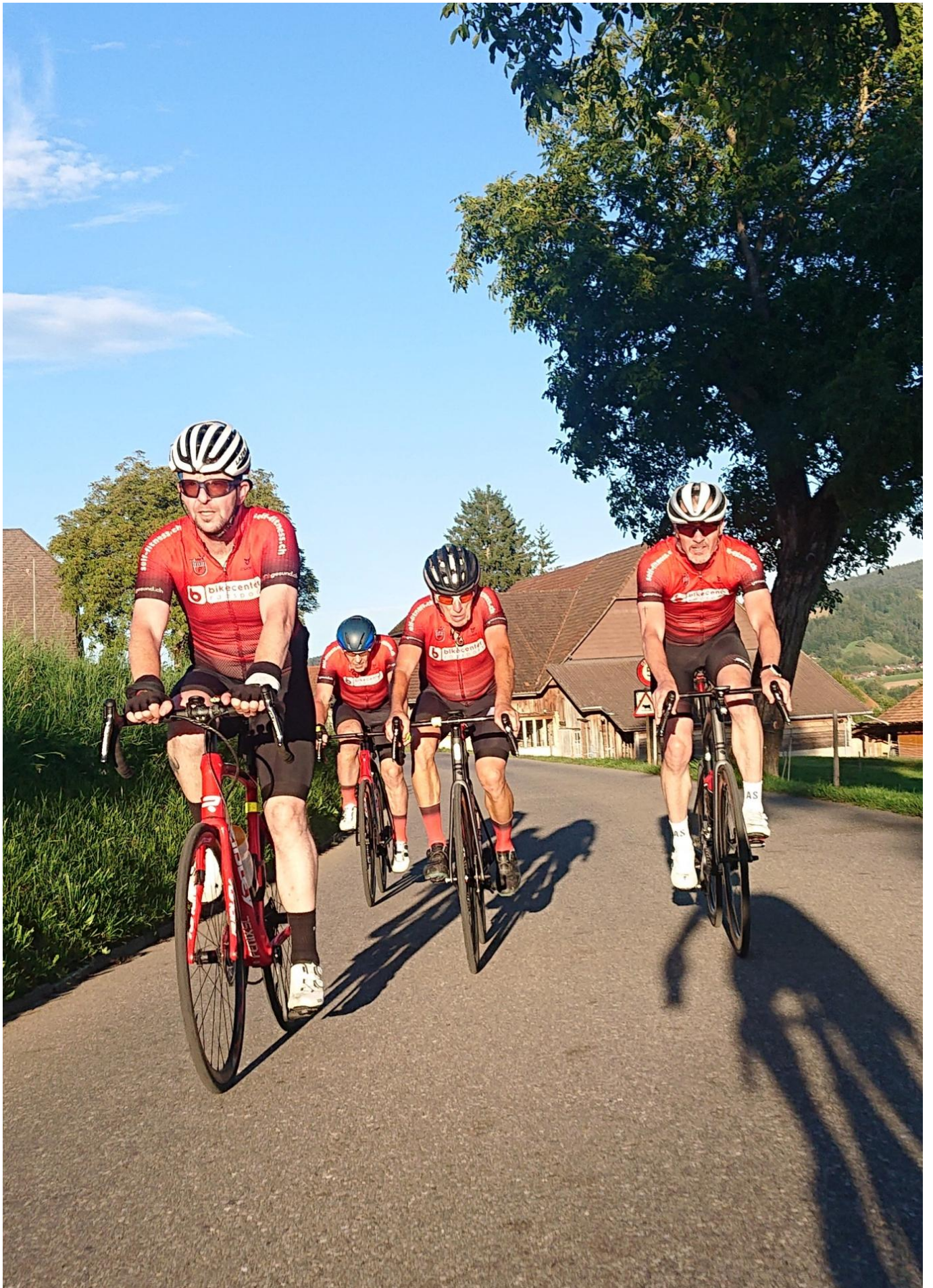
Mittwochstraining, 03.09.2025 – Genuss Gruppe