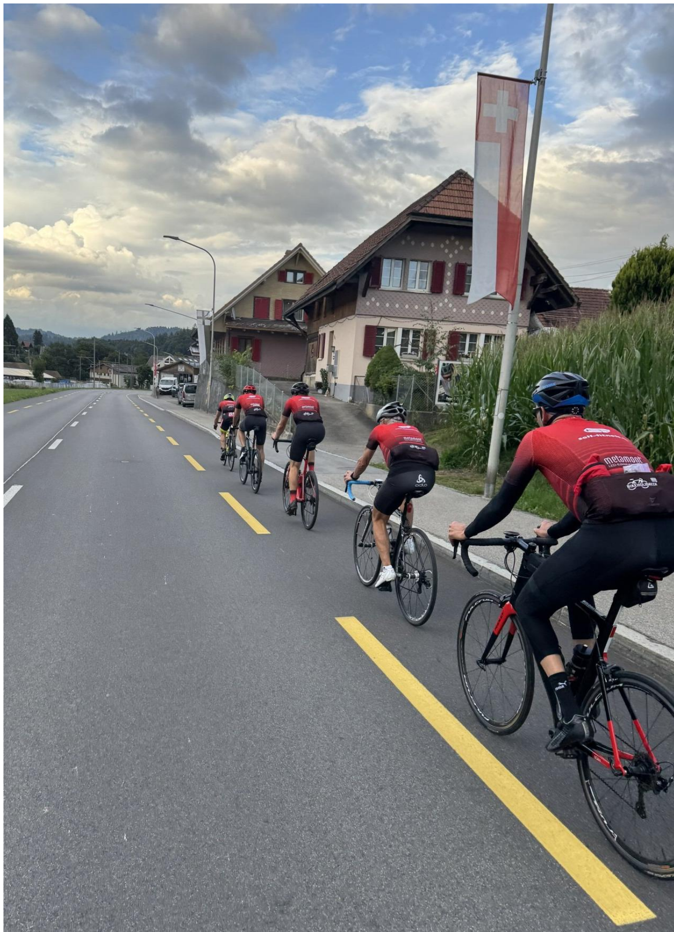
Mittwochstraining, 30.07.2025 – schnelle Gruppe